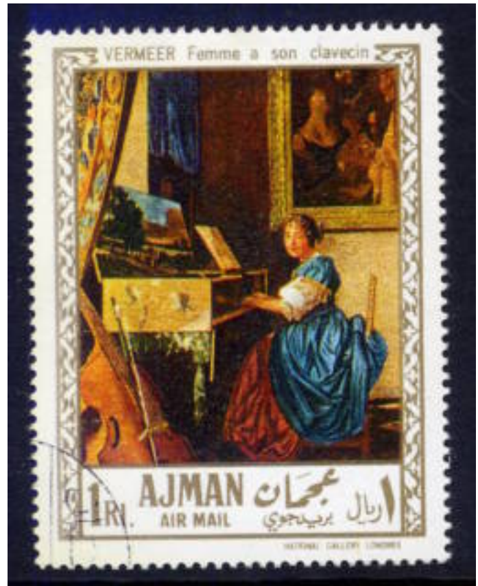
Een spinet op een Ajman zegel.

Veertjes en mechanieken overgebracht naar hamertjes met een vilten kop, die tegen de snaren worden aangeslagen.