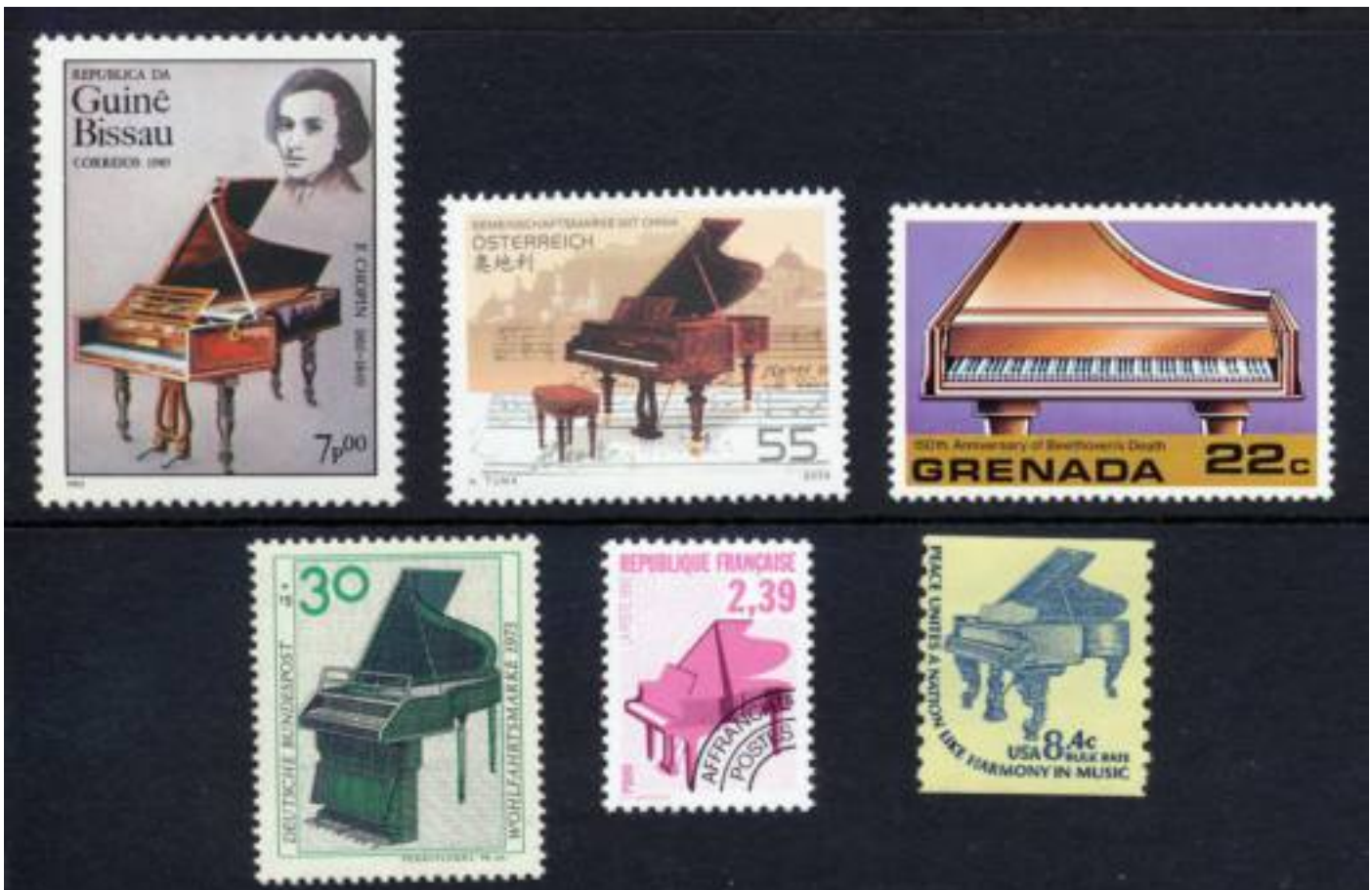
Diverse vleugels op postzegels.