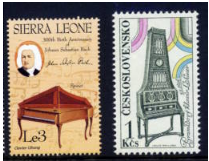
Een spinet op de postzegel uit Sierra Leone en een virginaal op een zegel van het voormalige Tsjecho-slowakije.

Voor een musicus en speler van de diverse instrumenten is het belangrijk hoe de snaren aangespeeld worden Bij een klavecimbel worden de snaren door middel van kleine pennetjes die aan de mechaniek zitten aange-tokkeld en wat ook het karakteristieke geluid geeft aan het instrument. . Bij een piano worden de snaren vanaf de toets via een systeem van