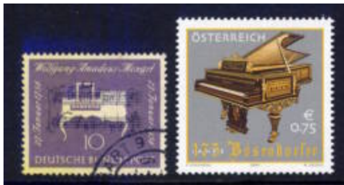
een Duitse postzegel met een piano uit de tijd van Mozart en een postzegel uit oostenrijk met een Bösendorfer.

Maar de grote doorbraak kwam toen er toetsinstrumenten werden gemaakt waarbij een stemming werd gebruikt met een verdeling van het octaaf in 12 gelijke delen, zodat het mogelijk was om naar andere toonsoorten te gaan.