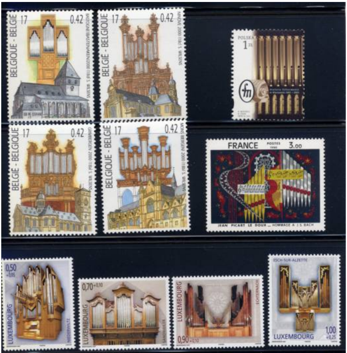
Verschillende orgels op postzegels.

Het instrument is dus geen snaarinstrument, maar kan doordat de toon wordt voortgebracht door lucht ook tot de blaasinstrumenten worden gerekend. Voor de postzegelverzamelaar is slechts van belang de schitterende zegels die er gemaakt zijn van de majestueuze instrumenten, waarvan hieronder enkele voorbeelden. Uit België, Frankrijk en Luxemburg met prachtige series, maar andere landen doen hier niet voor onder. Tot slot een zegel uit Polen met een aantal grote orgelpijpen.