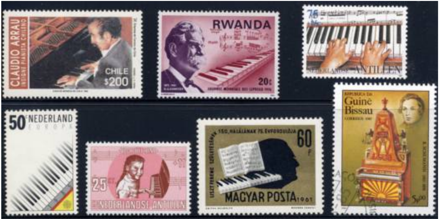
Diverse piano afbeeldingen.