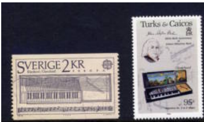
Een polychord op een zegel uit Zweden en clacichord op een postzegel van de Turcs and Caicos Islands.

De oudste instrumenten, waarvan we kunnen zeggen dat zijn 'toetsinstrumenten' ( instrumenten waarbij toetsen worden gebruikt om een toon te produceren ) Dan moeten we denken aan een monochord, met 1 snaar waarbij vibratie mogelijk was doordat er rechtstreeks contact was tussen de toets en de snaar waartegen geslagen werd. Dan onvermijdelijk natuurlijk het polychord met meer snaren, dat overgaat in een spinet, virginaal, klavechord en cembalo.