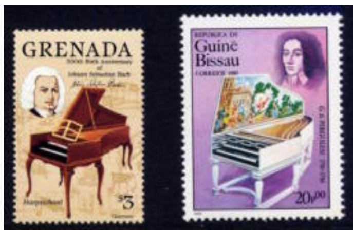
Klavecimbels op zegels uit respectievelijk Grenada en Guiné Buisau.

Een handicap, waarbij het niet of zeer moeilijk was om tussen de verschillende toonsoorten te moduleren (overschakelen naar andere toonsoorten). Bij een instrument als klavecimbel of orgel werd, om dat te ondervangen, een extra manuaal (toetsenbord) toegevoegd, maar was niet voldoende.