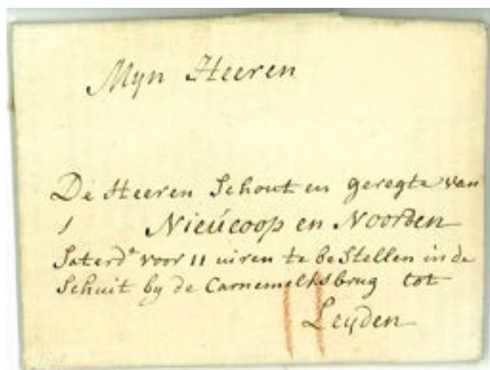
Trekschuitbrief, 1745 van 's-Gravenhage naar Nieuwkoop.

De trekweg van Leiden naar Delft en 's-Gravenhage