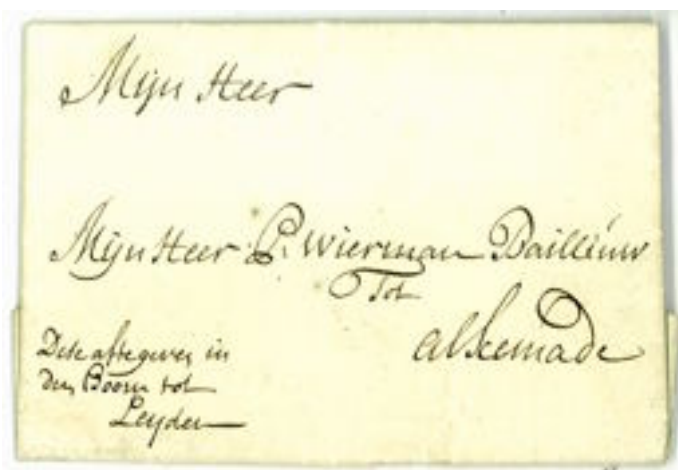
Kasteleinsbrief. 1727 van 's-Gravenhage naar Alkemade.

Het was namelijk gebruikelijk om brieven die per trekschuit vervoerd werden altijd vooruit betaald ( franco ) te verzenden. Doch deze brief is nog van voor de tijd dat de eerste Leidse Postmeester Nicolaas Clignet door het Leidse gerecht op 29 oktober 1663 werd benoemd en in die tijd waren er nog weinig voorschriften wat betreft het brievenvervoer.