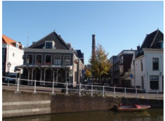
Het vroegere veerhuis aan de Korte Mare in Leiden.

Artikel is eerder verschenen onder de titel "Spuren der Vergangeneit " in het verenigingsblad " Nederland onder de Loep ", Rundbrief 188, april 2011, een uitgave van de Arbeitsgemeinschaft Niederlande e.V. im BDPH.