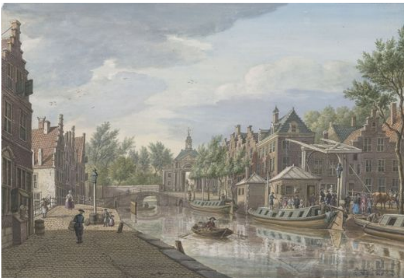
Trekschuiten bij de Marepoort in Leiden, 1771. P.C. La Fargue ( RAL )

Afbeelding 12.) laat ons op een aquarel van P.C. La Fargue uit 1778 de gracht Korte Mare te Leiden zien waar eeuwenlang het begin - of eindpunt van de trekschuitdienst tussen Leiden en Haarlem was. Direct naast de in 1863 afgebroken Marepoort was het veerhuis met stal voor de trekpaarden. De stal is in 1945 gesloopt en moest plaats maken voor een