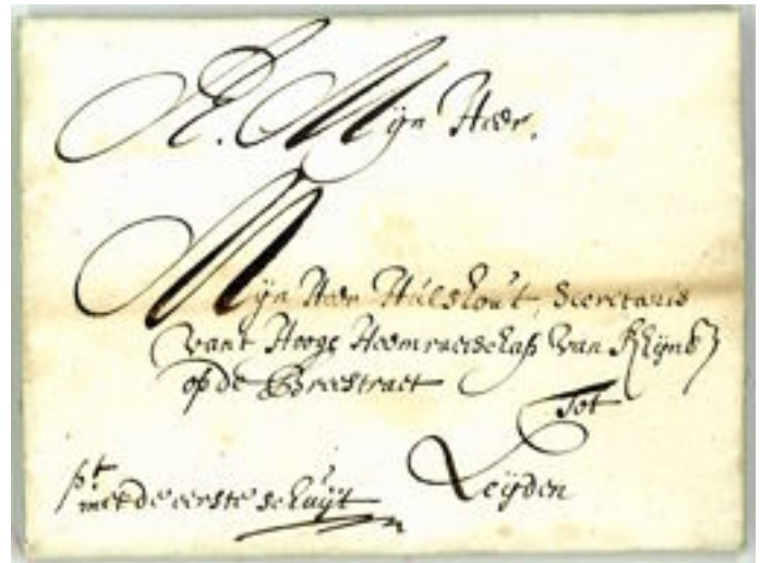
Pt met de eerste schuit ( links onder )

Ja, daar is nog steeds het een en ander te zien, maar blijven wij misschien om te beginnen bij de posthistorie. Afbeelding 1.) laat een brief zien uit 1659, per eerste trekschuit vanuit