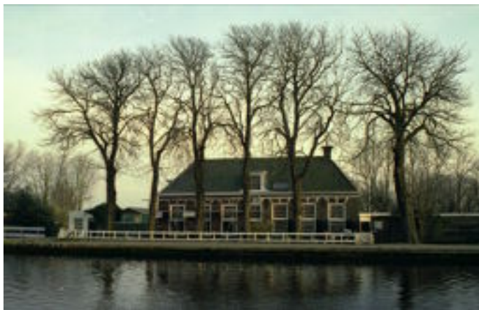
Delftse Schouw in 2003.

Afbeelding 5.) Een postkaart van ongeveer 1920 geeft ons een indruk van het stadsbeeld