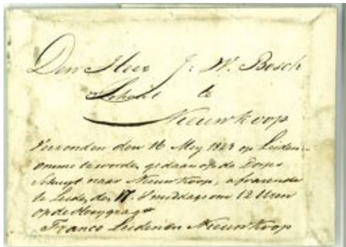
Schuitbrief, 1823. Van Velsen naar Nieuwkoop.

Waarschijnlijk is de brief vanaf Haarlem eveneens per trekschuit naar Leiden vervoerd,om aansluitend met de trekschuit die van de Hooigracht vertrok, via het Utrechtse Veer, over de Oude Rijn naar Alphen a/d Rijn gebracht werd en vandaar naar Nieuwkoop. Het totale port, waarschijnlijk