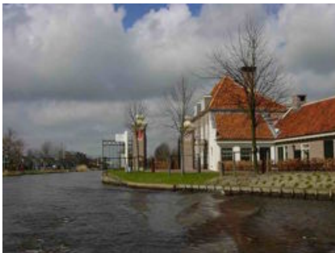
Tolhuis en Tolhek in Oegstgeest

Om tussen de steden Amsterdam en Rotterdam een optimale verbinding over het water tot stand te brengen, werd tussen de steden Haarlem en Leiden een 28 1/2 km lang kanaal gegraven dat in 1657 bevaarbaar was voor de trekschuiten. Doordat het kanaal een rechte lijn vormde, kon de trekschuit de afstand tussen de Raampoort aan het