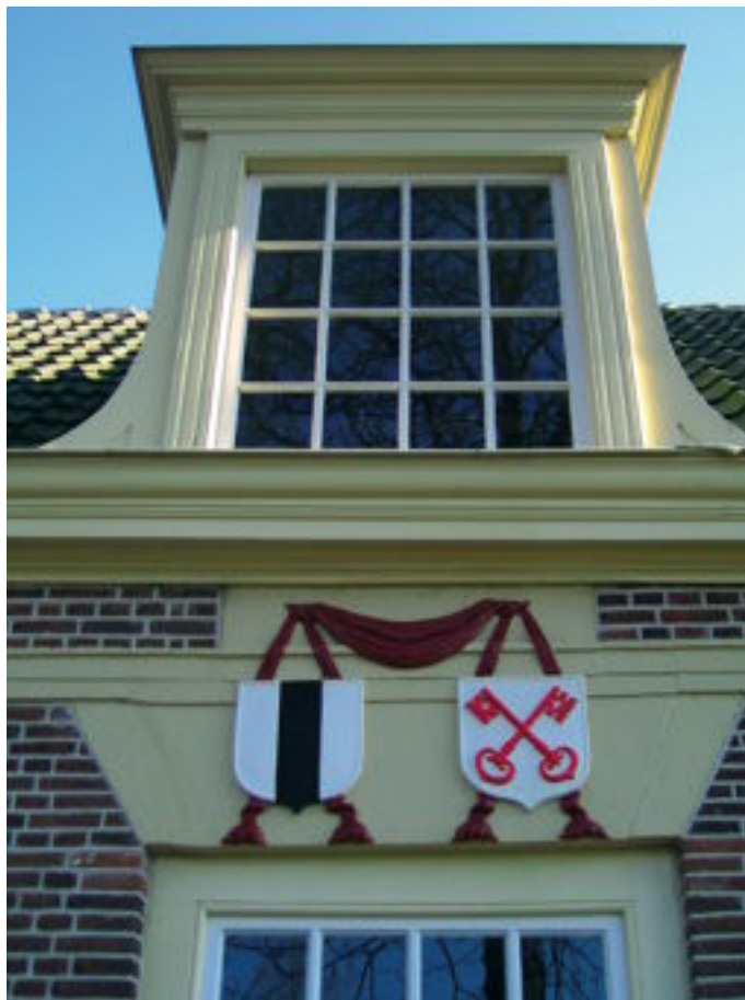
Delftse Schouw in 2003. Wapens van de steden Delft en Leiden boven de ingangsdeur.

" Den Boom " was een herberg gelegen aan de Rijn ( nu Nieuwe Rijn geheten ) en stond vlak bij de Karnemelksbrug. De naam " Den Boom " heeft waarschijnlijk zijn oorsprong daarin dat men toen een loopbrugje, hooggelegd voor de doorvaart van kleine schepen en slechts geschikt was voor voetgangers, een " Boom " noemde.