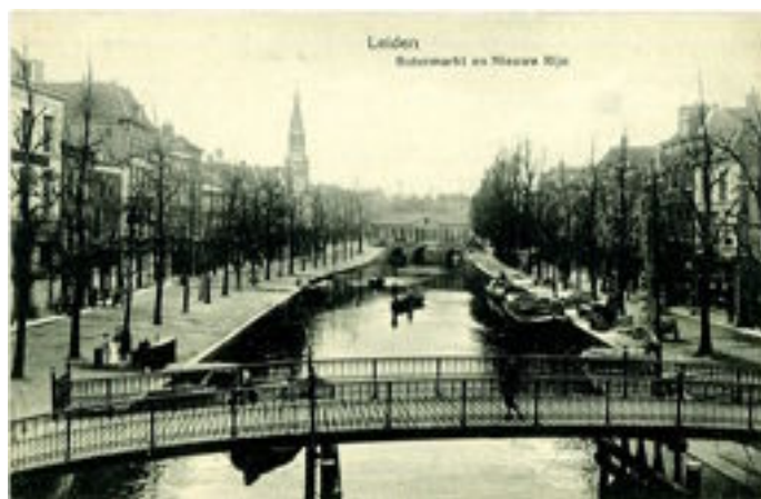
Oude Karnemelksbrug, Leiden.

Afbeelding 3.) laat een brief zien uit 1745, per trekschuit vervoerd van 's-Gravenhage via Leiden naar Nieuwkoop. Het briefport van 's-Gravenhage naar Leiden was vooruit betaald en voor het traject van Leiden naar Nieuwkoop