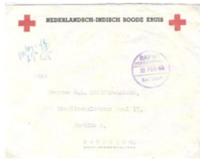
Omslag zonder postzegel van het Rode Kruis centraal informatie bureau in Batavia, naar Bandoeng. Stempel van RAPWI postkantoor te Batavia. Datum 19 februari 1946.

Deze enorme taak van het verkrijgen en doorgeven van alle noodzakelijke informatie aan de autoriteiten, niet alleen op de eilanden, maar eigenlijk over de gehele wereld, vielen toe aan RAPWI, het Rode Kruis en het KDP (Kantoor voor Displaced Persons ). In de verschillende RAPWI locaties werden contact en informatie eenheden opgezet. Het Rode Kruis had enorme ervaring met dit soort werk. Hierbij is ook vooral niet te vergeten, dat er zeer veel Displaced Persons waren van andere rassen en nationaliteiten. Het Chinese