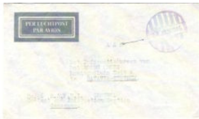
Omslag zonder postzegel naar het Rode Kruis Informatie Bureau in Batavia van nummer 6 RAPWI, sectie controle, contact en informatie, in Semarang. Datum 24 januari 1946. Zie het vage handstempel Semarang.

Onderzoeksvraag aan het Rode Kruis te Bandoeng op een 31/2 cent briefkaart van VOOR de oorlog, van een geïnterneerde in Kamp 11, Banjoebiroe dichtbij Ambarawa, naar de verblijfplaats van een krijgsgevangene. Bijgeschreven met potlood: "niet op Java 17/9" en "6/1/43 van Thai(land), dus in Thai(land). De persoon was dus naar Thailand vervoerd als slavenarbeider.