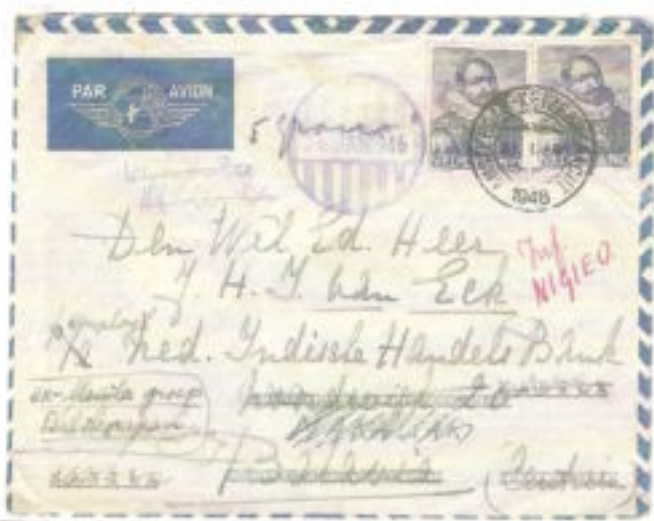
Omslag van Bussum, met een stempel Amsterdam 21/1/46, naar een voormalige werknemer van de Nederlandsch Indische Handelsbank in Batavia. Aankomst 28/1/46. Verschillende traceringsmarkeringen. NIGIEO: Netherlands Government Import & Export Organisation.