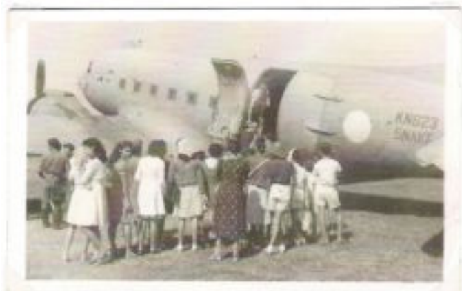
Dakota van 31 Squadron RAF evacueren geïnterneerden van Solo. De oorspronkelijke rode, witte en blauwe ringen van de RAF zijn weggeschilderd, omdat de Indonesiërs bij het zien van rood, wit en blauw het vliegtuig weigerden te laten vertrekken, omdat zij deze kleuren direct met Nederland verbonden.

Pas op 20 mei 1946 kon de evacuatie goed op gang komen, nadat de eindeloze onderhandelingen met de Indonesiërs tot een overeenkomst had geleid. Maar op 23 juli 1946 werd de evacuatie al weer stop gezet, omdat de afspraken geschonden zouden worden. Gedurende deze korte tijd werden 19000 personen uit de binnenlanden gehaald door Dakota vliegtuigen van het 31 squadron van de RAF. Zij werden afgezet in Solo en Soerabaja, waarna 5000 van hen meteen doorgevlogen werden naar Batavia en de overigen naar Semarang, om van daar naar Batavia te reizen per schip. In Batavia kwamen zij (weer) in transitkampen, voordat zij naar Singapore en Bangkok werden verscheept, als tussenstop op weg naar Nederland. Vooral in Singapore gaf de toestroom van zo veel vluchtelingen een geweldige extra druk op de voorraden.