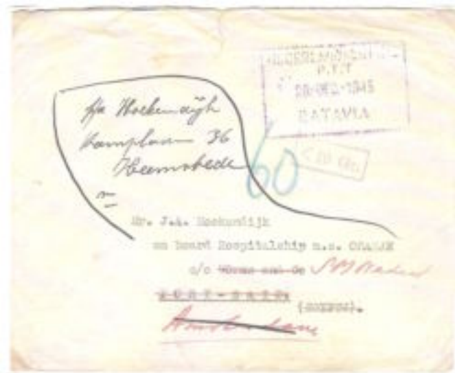
Omslag zonder postzegel van Batavia ( 26 december 1945 ) naar een evacuee aan boord van M.S. Oranje, een hospitaalschip, Doorgestuurd naar Amsterdam en vandaar weer naar Heemstede. Zie stempel onder 10 gram. Het dubbele bedrag aan port werd geheven - 60 cent - , maar dat is blijkbaar nooit betaald.

Rond november 1946 waren ongeveer 110000 krijgsgevangenen, geïnterneerden en anderen geëvacueerd uit Nederlands Indië. Van hen gingen 78000 naar Nederland. Tijdens de oprichting van Rapwi waren plannen gemaakt voor de opvang van de evacues langs de route naar Europa. Om dat allemaal te coördineren was er een RAPWI staf officier toegevoegd aan het Geallieerde Hoofdkwartier in Kandy op Ceylon, waar vandaan de Nederlanders ook opereerden met de KDP. In Kandy was ook een RAPWI doorgangskamp voor hen, die moesten wachten op verder vervoer. Zowel hier als in Colombo waren meer dan voldoende eerste levensbehoeften voorhanden. In Port Said kregen de evacues winterkleding, omdat zij absoluut niet gewend waren aan de Hollandse winters.