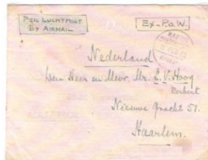
Hergebruikte omslag zonder postzegel met opschrift EX-POW naar Haarlem van Tijdens Kamp ziekenhuis in Batavia. RAPWI postkantoor, Batavia in zwart ( meestal stempel in violet ) Datum 11-2-1946.