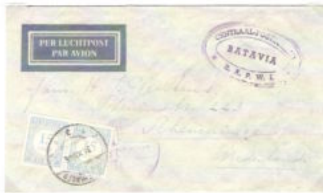
Omslag zonder postzegel naar Scheveningen van Batavia. Stempel met balken van 24 december 1945 ( vroegst bekende gebruik ) 30 cent strafport.