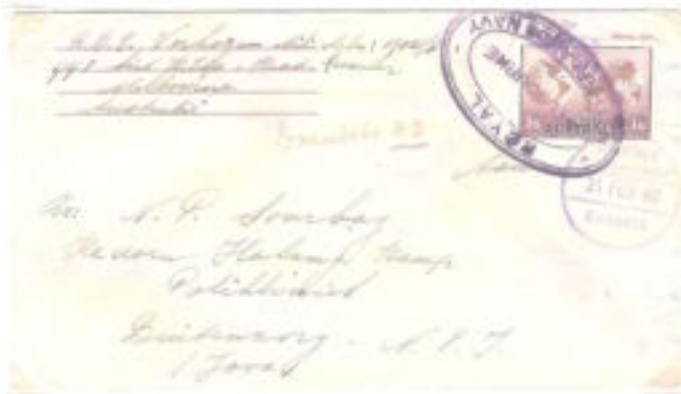
Enveloppe van het Amerikaanse Rode Kruis van Australië naar Buitenzorg; gefrankeerd 1/6 en gestempeld met ongedateerd Royal Netherlands Navy, Melbourne cachet. Aankomst 21 februari 1946 op het RAPWI postkantoor te Batavia.