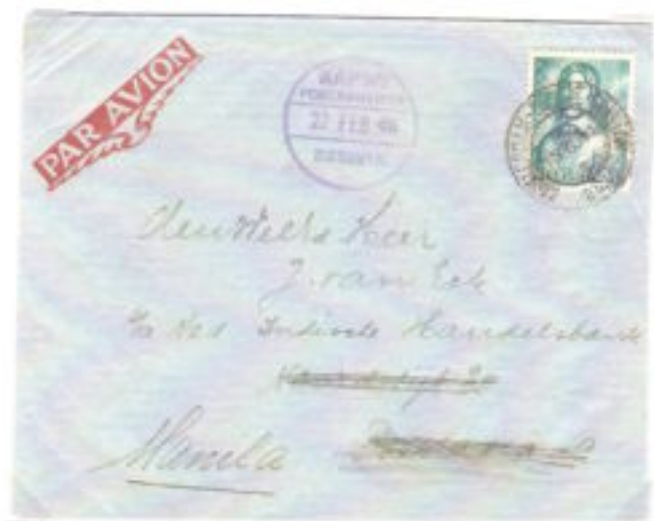
Omslag behandeld door RAPWI en doorgezonden naar Manilla.