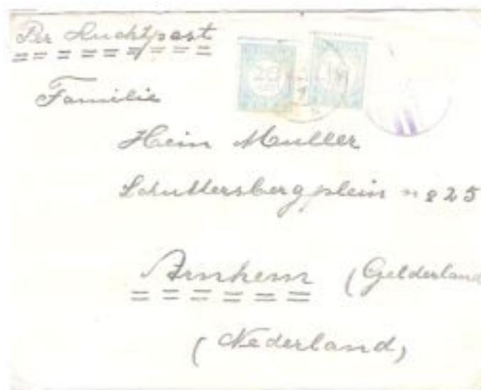
Ook hier 30 cent strafport. Dus ook geen boete toeslag!