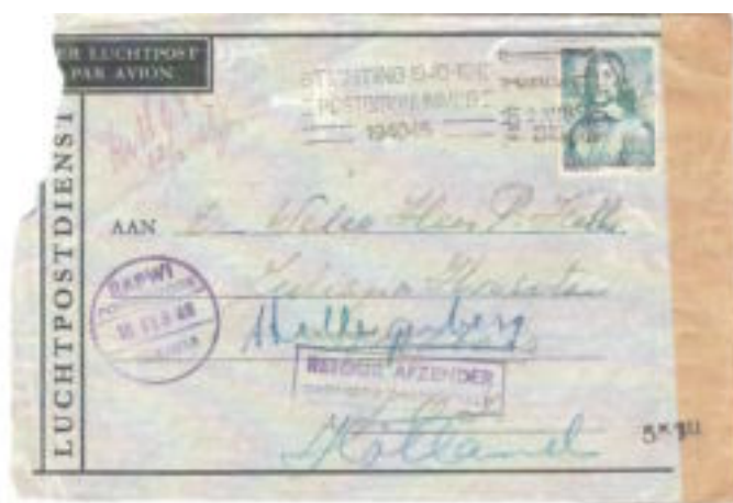
Omslag van Hillegersberg, met stempel Rotterdam 2 november 1945 , naar het Juliana ziekenhuis in Soerabaja. Gecensureerd op retourweg naar Nederland.