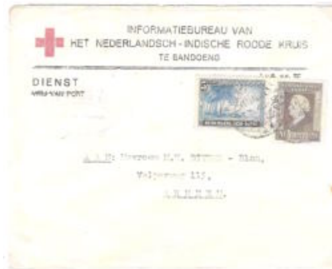
Officiële omslag van Het Rode Kruis Informatie Bureau te Bandoeng naar Nederland. "Vrij van Port" weggestreept en gefrankeerd met 25 cent. Datum 21 september 1946. Zie ook het ovasle stempel van PAP-WI/ Rode Kruis.

De taak van het zoeken naar vermisten lijkt eindeloos en deze taak ging dan ook nog lang door, nadat RAPWI haar verantwoordelijkheden had overgegeven en nadat de Britse strijdkrachten Java hadden verlaten.